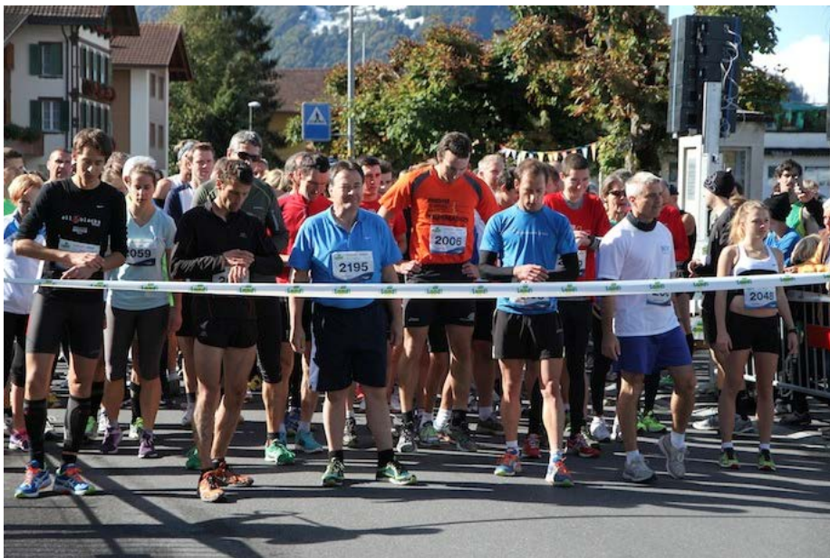
Vor dem Start des neuen Zehnkilometerlaufes.