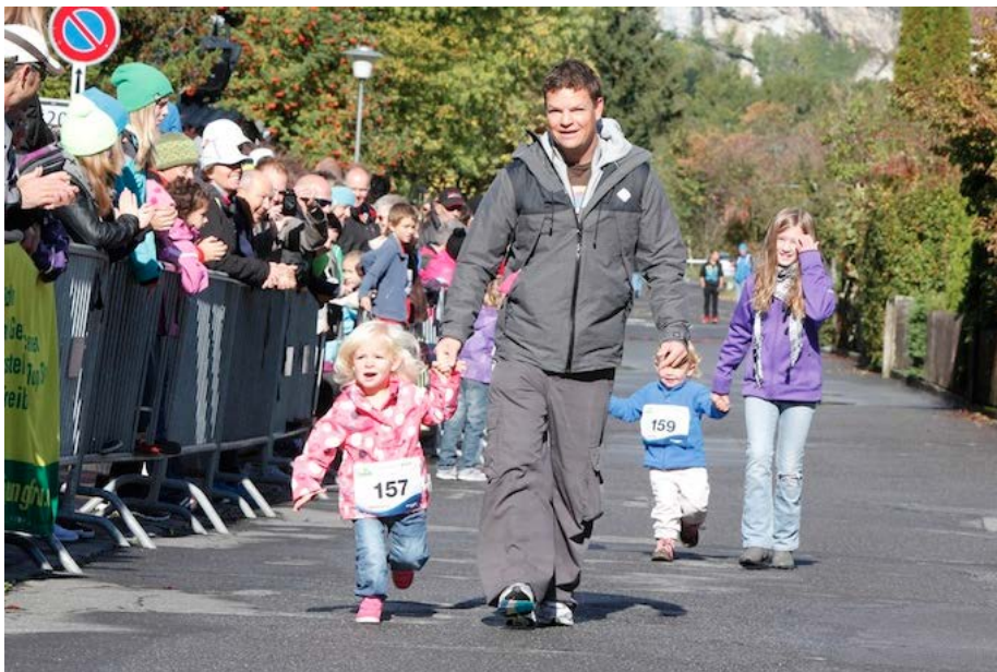
Gehört zum Brienerseelauf: Das Pfüderirennen mit den Kleinsten.