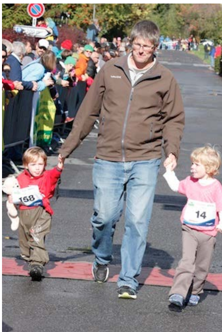
Nicht selten machen auch die Eltern beim Pfüderirennen mit.